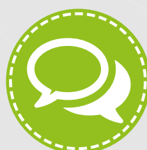
Foros y Chat