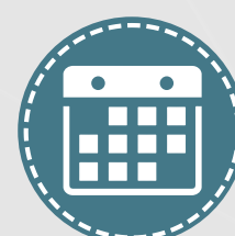
Años de Experiencia