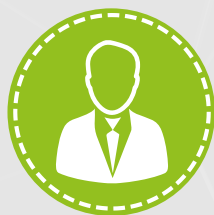
Expositores de Prestigio